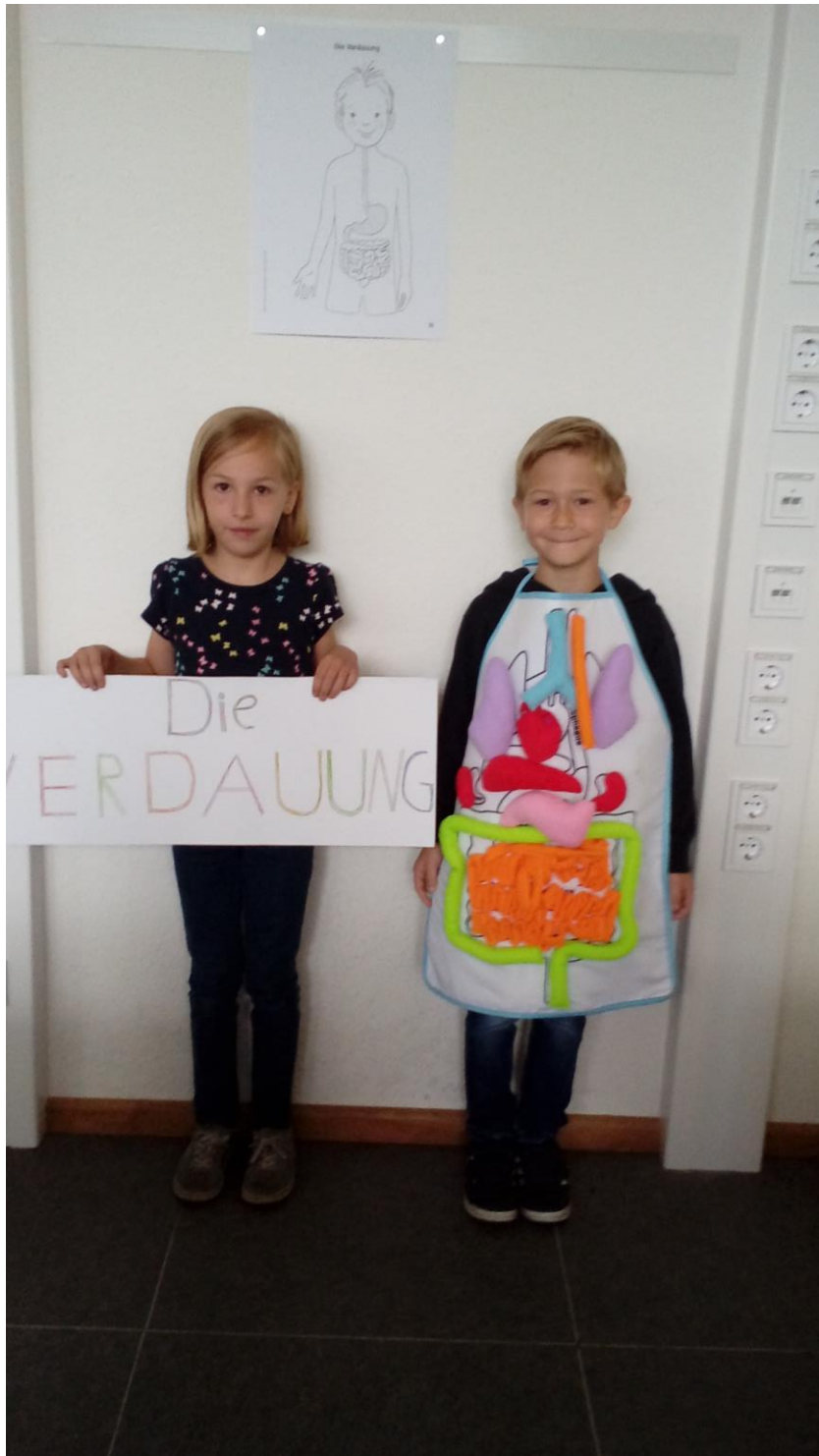
Das haben wir über die Verdauung gelernt.