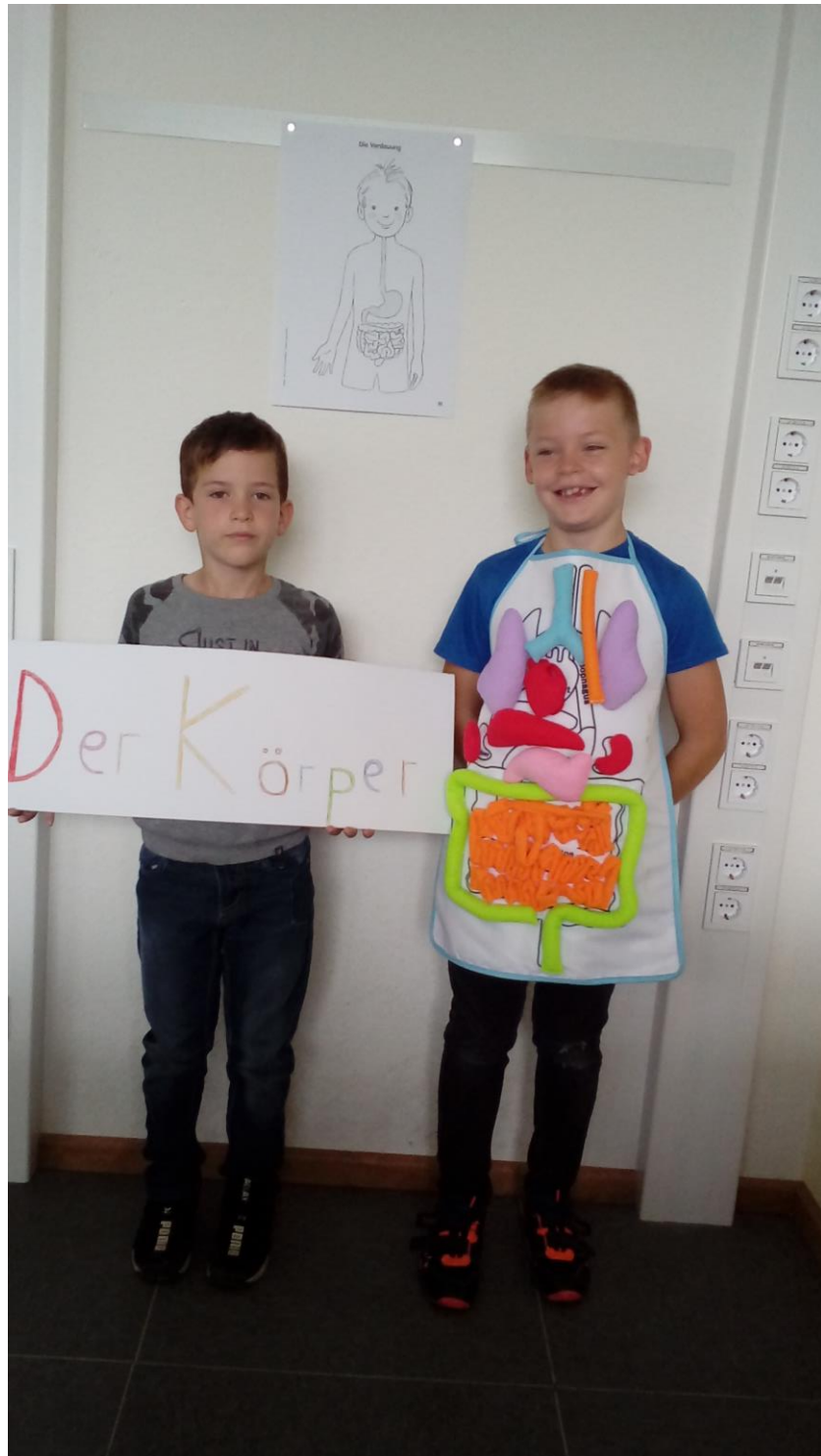
Im Sachunterricht sprechen wir über den Körper.